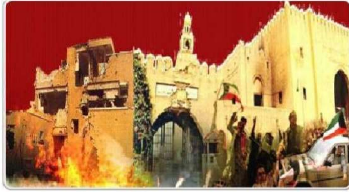
شكل رقم (٣٣)