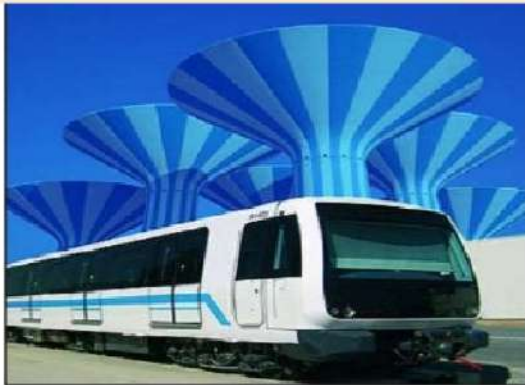
شكل رقم (٥٠)

طريق الجهراء ساهم في حل الأزمة المرورية فضل بين حركة المرور المحلية والعابرة ورفع القدرة الاستيعابية لطريق الجهراء خفضت نسبة الحوادث وقلت الازدحام المروري