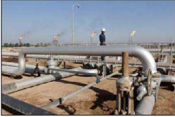
شكل رقم (٤٤)

هي أكبر مصفاة في العالم، تبنى بمرحلة واحدة وستنتج ٦١٥,٠٠٠ برميل يوميًا من الوقود الذي يحتوي على معدل منخفض من الكبريت، حيث تبلغ طاقة التكرير الكويتية ٤, ١ مليون برميل يوميًا، وتتمتع المصفاة بمرونة عالية، حيث إنها مصممة لمعالجة أنواع مختلفة من النفط الخام الكويتي بما في ذلك النفط الخام الثقيل، كما أنها ستوفر الوقود النظيف لمحطات الطاقة.