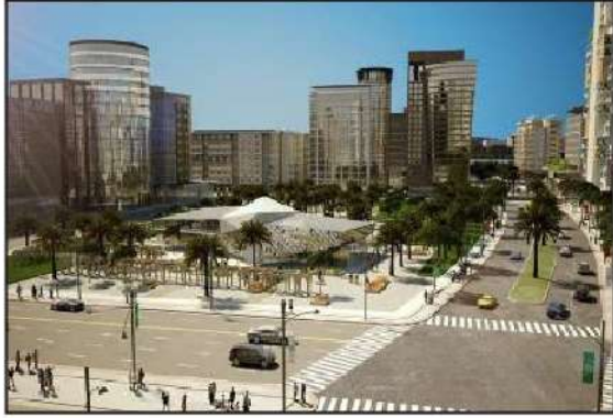
شكل رقم (٤٢)

تعتبر مدينة جنوب المطلاع أكبر مشروع إسكاني في تاريخ دولة الكويت، وأضخم المشاريع الإسكانية المتكاملة للخدمات بطاقة استيعابية تصل إلى ٤٠٠,٠٠٠ نسمة ويضم ١١٦ مدرسة و١٢ مركزاً للصحة العامة.