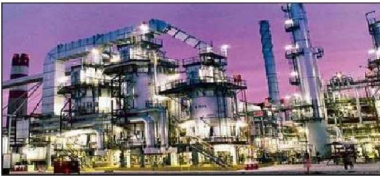
شكل رقم (٤١)

هو مشروع استراتيجي تنموي يهدف إلى تحريك العجلة الاقتصادية في دولة الكويت من خلال توسيع وتطوير مصفاة ميناء عبدالله وميناء الأحمد ليكونا مجتمعاً تكريرياً متكاملًا بطاقة