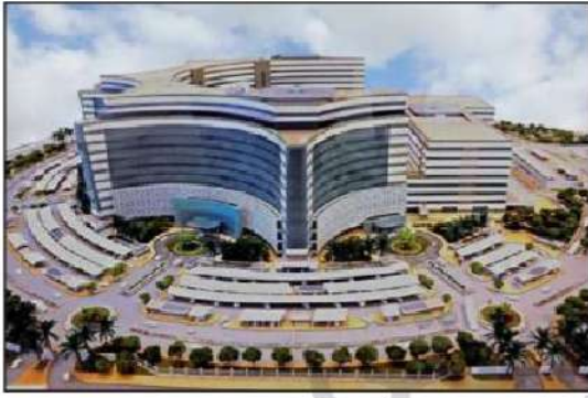
شكل رقم (٣٨)

إن المسؤولية التنموية للدولة تتقاسمها كل السلطات، وتضم كل مكونات المجتمع، لتحقيق إنجازات حقيقية للمجتمع ومشاريع ضخمة عملاقة في ظل موارده وإمكاناته.