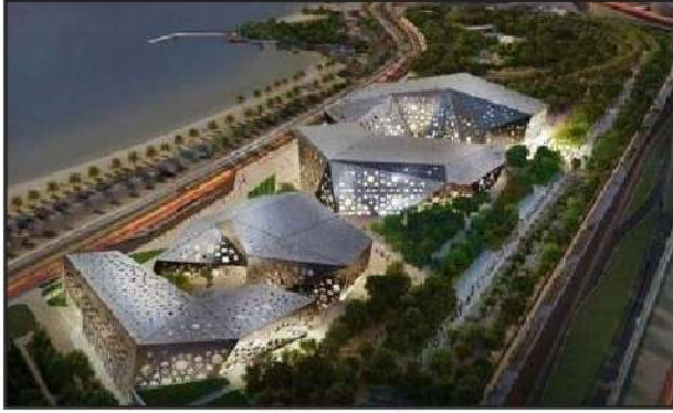
شكل رقم (٣٩)

هو معلم ثقافي بارز وتحفة معمارية وصرح تنويري فريد من نوعه يقع في قلب مدينة الكويت، ويتكون المبنى الذي استغرق تصميمه وإنجازه ٢٢ شهرًا على مجموعة من الأشكال الهندسية المركبة والمستوحاة من العمارة الإسلامية، حيث توجد فيه أربعة مباني ضخمة على شكل الجواهر المبعثرة ويضم المبنى ٣ مسارح و٣