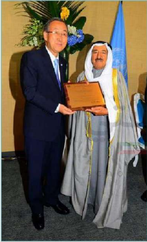
شكل رقم (٣١)

في العام ٢٠١٤ تم اختيار حضرة صاحب السمو الشيخ صباح الأحمد الجابر الصباح من قبل هيئة الأمم المتحدة قائداً للعمل الإنساني لعام ٢٠١٤م وتسمية الكويت مركزاً للإنسانية، فهذا الاختيار جاء تنويحاً وتكريماً لما قدمه سموه من جهود متواصلة لخدمة الإنسانية والعمل الإنساني، حيث يُعدُّ هذا الاختيار والتكريم الذي تقوم به منظمة الأمم المتحدة اعترافاً رسمياً من قبلها بدور الكويت الرائد في العمل الإنساني، ومساهمتها الفعالة في مواجهة الأزمات والكوارث الإنسانية الكبرى، إلى جانب جهودها في القضاء على الجوع والفقر والامية، والتصدي للأمراض والأوبئة، والدفع بعملية التنمية في البلدان الفقيرة من مختلف المناطق والقارات.