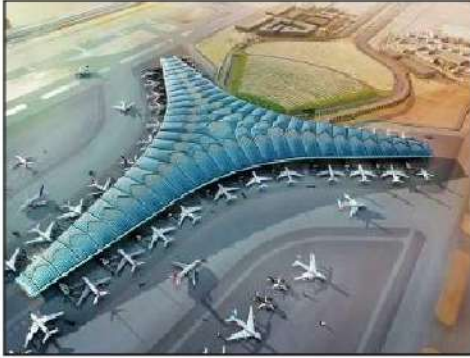
شكل رقم (٤٠)

جاءت مشاريع تطوير مطار الكويت الدولي وتوسعته انطلاقاً مع رؤية سمو أمير البلاد لجعل دولة الكويت مركزاً مالياً، وتجاريًا تأتي مساهمة من الإدارة العامة للطيران المدني في هذه الجهود التي تقوم بها الدولة من خلال تطوير البنية التحتية من مدرجات وممرات وساحات وقوف للطائرات لاستقبال جميع أنواع الطائرات