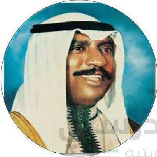
شكل رقم (٢٦)

ارتبط اسم الشيخ سعد بالعديد من الأحداث والإنجازات التي شاءت الأقدار أن تكون الأخطر والأهم في تاريخ الكويت المعاصر، والتي استطاع فيها مع بقية الرفاق من جيله العبور بسفينة الوطن بسلام وأمان، فنال ثقة الجميع واحترامهم، وكانت كلماته التي عبر فيها عن تواضعه وإنكاره الذات بالقول ( نحن جميعاً في سفينة واحدة نبحر فيها في بحر مملوء بالصخور المرجانية تتصاعد وتتكاثر من حولها الأمواج والعواصف والسحب ، هذه السفينة بيد ربان ماهر استطاع هذا الربان النوخذة أن يقود السفينة ونحن بحارتها إلى بر الأمان )، تدرج في المناصب التي تولاها من منصب وزير داخلية إلى وزير دفاع وعضو في المجلس التأسيسي ولجنة وضع الدستور لسنة ١٩٦٢م. حتى أصبح ولياً للعهد ورئيساً لمجلس الوزراء عام ١٩٧٧م. كما شارك الشيخ سعد العبدالله أخاه الشيخ جابر الأحمد في التصدي للعدوان العراقي الآثم سنة ١٩٩٠م فأطلق عليه بطل التحرير تقديراً لدوره في التصدي لهذا العدوان، كما أطلق عليه أيضاً بطل التعمير بعد أن تحررت الكويت ، حيث قام بمتابعة وتعمير البنى التحتية التي دمرها العدوان العراقي، تنازل الشيخ سعد عن الحكم في بيان لمجلس الأمة نظراً لحالته الصحية، وقد حظي بلقب الأمير الوالد ، توفي الشيخ سعد عام ٢٠٠٨م بعد عطاء وإنجازات حافلة سجلها له تاريخ الوطن بكل التقدير والإجلال.