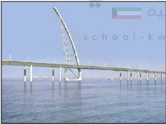
شكل رقم (٤٥)

يعد مشروع جسر الشيخ جابر الأحمد الصباح أحد أهم المشاريع العملاقة المدرجة ضمن الخطة التنموية للدولة، وهو أطول جسر بحري في العالم، حيث يبلغ من الطول ٣٧,٥ كيلو متر في جون الكويت، حيث يربط مدينة الكويت بمدينة الصبية الجديدة ويهدف إلى اختصار المسافة بين مدينة الكويت ومدينة الصبية الجديدة