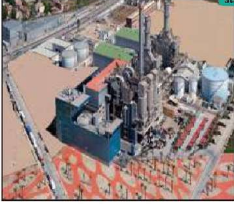
شكل رقم (٤٦)