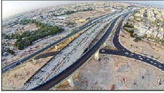
شكل رقم (٤٩)

ويشكل المشروع أحد الحلول المهمة للازدحام المروري، فهو سيساهم بشكل كبير في الفصل بين حركة المرور العابرة وحركة المرور المحلية، ورفع القدرة الاستيعابية لطريق الجهراء، مما سيؤدي إلى التقليل من الازدحام المروري، وخفض نسبة الحوادث المرورية، كما يساهم برفع مستوى الخدمات لمستخدمي الطريق.