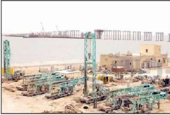
شكل رقم (٤٨)

يعد مشروع ميناء (مبارك الكبير) البحري من أهم مشاريع خطة التنمية التي تقوم بها دولة الكويت ، ويهدف إلى إنشاء ميناء بحري رئيسي سعة ٦٠ مرسى يكون محوراً رئيسياً للنقل يربط الأرض بالبحر بوسائط نقل متعددة كالطرق السريعة، والسكك الحديدية، ويعزز مكانة الكويت كمرکز مهم للنشاط الاقتصادي الإقليمي.