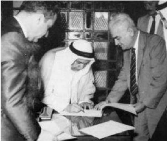
شكل رقم (٢٣)

في ١٩ يونيو ١٩٦١ م أعلن أن الكويت نالت استقلالها على أثر تبادل الرسائل بين المقيم السياسي البريطاني في الخليج العربي وبين الشيخ عبدالله السالم الصباح، والتي ألغت اتفاقية الحماية المعقودة عام ١٨٩٩ م واستبدلت باتفاقية جديدة سميت باتفاقية الصداقة والتشاور . وفي نفس العام انضمت دولة الكويت إلى جامعة الدول العربية في حين تأخر