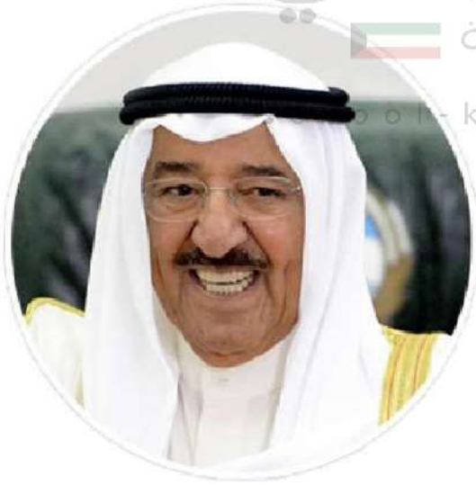
شكل رقم (٣٦)