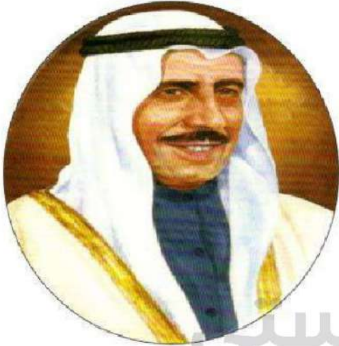
شكل رقم (٢٤)

يعتبر الشيخ صباح السالم أول ولي للعهد في تاريخ دولة الكويت، حيث عين في هذا المنصب بموجب مرسوم أميري صدر في ٣٠ أكتوبر ١٩٦٢م، وهو الحاكم الثاني بعد استقلال دولة الكويت.