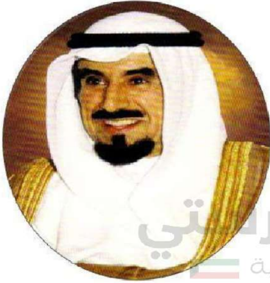
شكل رقم (٢٥)

هو الأمير الثالث بعد الاستقلال، تميزت شخصيته بحب الخير والعطاء والحكمة، دخل الأمير الراحل معترك الحياة السياسية مبكراً في الحادية والعشرين من عمره، عندما عين عام ١٩٤٩م رئيساً للأمن في الأحدي واستمر في هذا المنصب لمدة عشر سنوات (١٩٤٩ - ١٩٥٩م)، وفي عام ١٩٥٩م تولى رئاسة الدائرة المالية، وأعاد تنظيمها على أسس تنظيمية متطورة -نسبة إلى تلك الفترة من عمر نهضة الكويت- مستعيناً بالخبراء والمستشارين الماليين، ومن