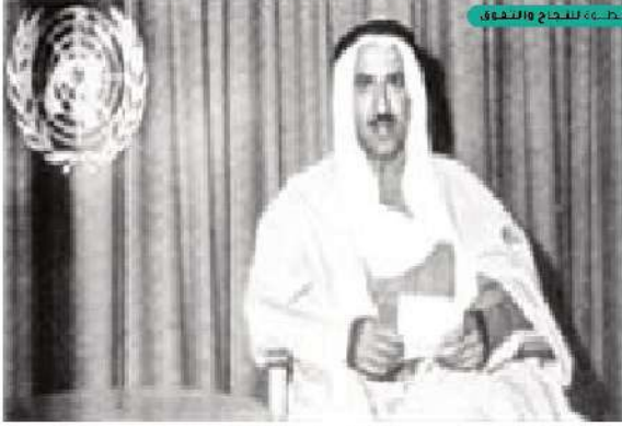
شكل رقم (٢٩)

في ١٤ مايو ١٩٦٣ قام الشيخ صباح الأحمد الصباح برفع العلم الكويتي لتكون الكويت إحدى دول منظمة الأمم المتحدة، حيث أصبحت تشغل العضوية رقم ١١١ من بين الدول المنتمية للمنظمة.