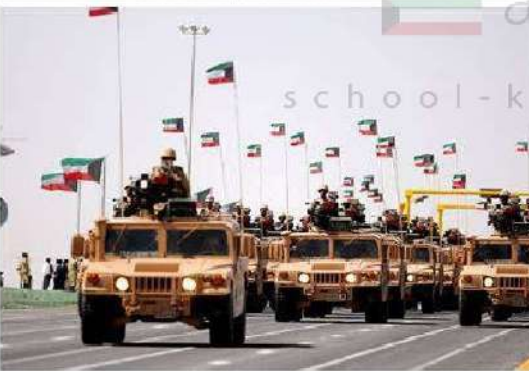
صور توضح تحرير دولة الكويت شكل رقم (٣٥)

في ظل رفض العراق الانقياد للشرعية الدولية، ومواصلة احتلاله لدولة الكويت، وتحدي الإرادة الدولية، تشكل -وبشكل سريع- ائتلاف عسكري مكون من حوالي ٣٢ دولة ضد العراق بقيادة الولايات المتحدة الأمريكية لتنفيذ قرارات مجلس الأمن الخاصة بانسحاب القوات العراقية من الكويت من دون قيد أو شرط، وبعد الحشود العسكرية، والتي كانت على رأسها قوات درع الجزيرة (التابعة لمجلس التعاون الخليجي) التي تشكلت عام ١٩٨٤م، وكانت جوهر المشاركة العملية لدول المجلس في حرب التحرير، ومع الإجماع الدولي، بدأت تبيت الحشود العسكرية مباشرة في الاستعداد لتحرير الكويت وبالفعل في فجر يوم الخميس ١٧ يناير ١٩٩١م بدأت معركة تحرير الكويت أو (عاصفة الصحراء)، حيث تم التمهيد لذلك بضربات جوية مكثفة على القوات العراقية وحشودها، أي بعد يوم واحد من انتهاء المهلة التي منحها مجلس الأمن للعراق، كما شنت طائرات قوات