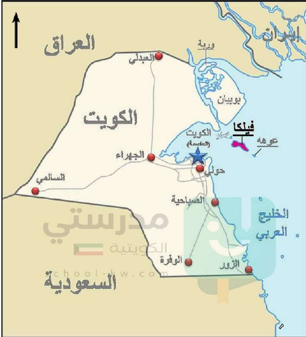
شكل رقم (٥١) خريطة توضح الجزر الكويتية