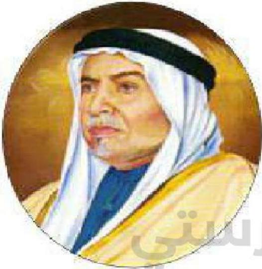
شكل رقم (٢٢)

يعد الشيخ عبدالله السالم الصباح النجل الأكبر للشيخ سالم المبارك الصباح، تولى في عهد الشيخ أحمد الجابر شؤون البلاد الإدارية والمالية قبل أن يتولى الإمارة رسمياً ١٩٥٠ م، والتي أصبحت في عهده دولة مستقلة ذات سيادة تامة، يحكمها نظام دستوري. هذا وقد لقب الشيخ عبدالله السالم بالعديد من الألقاب، كان أبرزها أبو الدستور، وأبو الاستقلال ، والتي أطلقت عليه خلال فترة حكمه الممتدة من ١٩٥٠ وحتى ١٩٦٥ م.