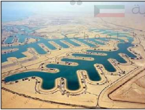
شكل رقم (٤٧)

أول وأكبر مشروع يُشَيّد بالكامل من قبل القطاع الخاص الكويتي، تقع مدينة صباح الأحمد البحرية في منطقة الخيران جنوب دولة الكويت، وتعد مدينة صباح الأحمد البحرية عملاً حضاريًا متميزًا ليس على مستوى المنطقة فحسب بل في العالم، فالإنجاز الذي تحقق لا يقتصر فقط على إنشاء مدينة متكاملة على