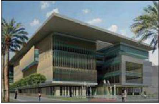
شكل رقم (٤٣)

يترجم مشروع مدينة صباح السالم الجامعية (الشدادية)، أحد أكبر المشاريع الإنشائية في الشرق الأوسط وأهمها حرص دولة الكويت على الارتقاء بالتعليم الجامعي، باعتباره محوراً أساسياً للتنمية البشرية.