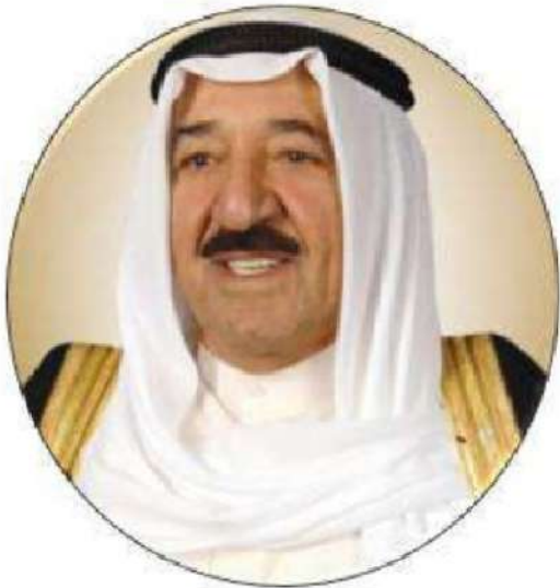
شكل رقم (٢٧)

حضرة صاحب السمو الشيخ / صباح الأحمد الصباح الأمير الحالي لدولة الكويت منذ ٢٠٠٦م