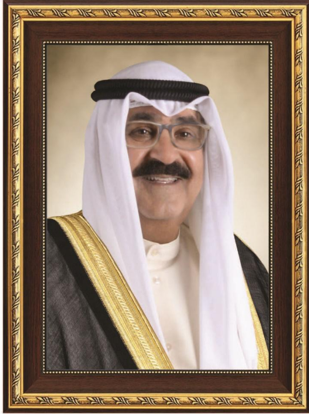
سمو الشيخ مشعل الأحمد الجابر الصباح ولي عهد دولة الكويت

H.H. Sheikh Meshal AL-Ahmad Al-Jaber Al-Sabah The Crown Prince Of The State Of Kuwait