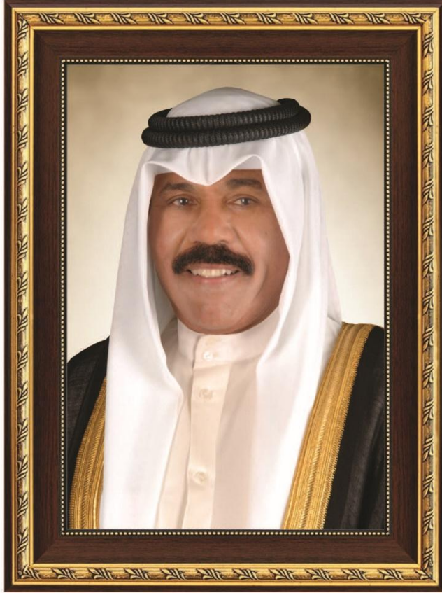
حضرة صاحب السمو الشيخ نواف الأحمد الجابر الصباح أمير دولة الكويت H.H. Sheikh Nawaf AL-Ahmad Al-Jaber Al-Sabah The Amir Of The State Of Kuwait